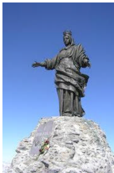
Statua della Madonna in vetta