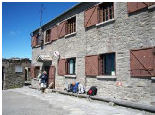
Il Rifugio Ca' d'Asti