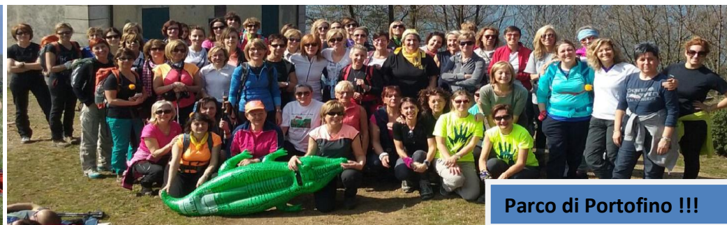
Parco di Portofino !!!