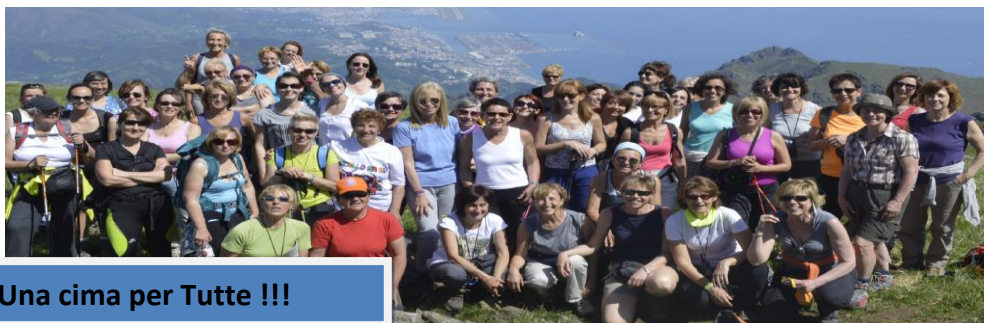
Una cima per Tutte !!!