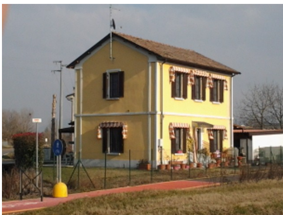
Stazione di Torrazza Coste