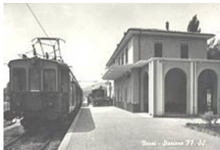
foto d'epoca - Stazione di Varzi