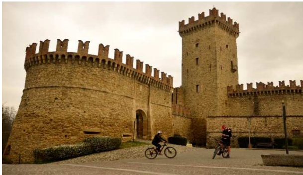
Il castello di Vigoleno e il suo imponente mastio

Itinerario circolare nel parco fluviale dello Stirone fra le province di Parma e Piacenza