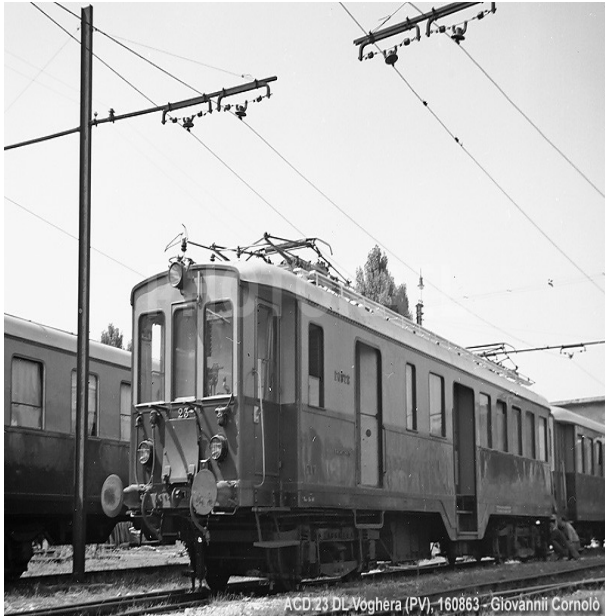
ACD 23 DL Voghera (PV), 160863

L'Automotrice Elettrica ACD 23 – foto d'epoca