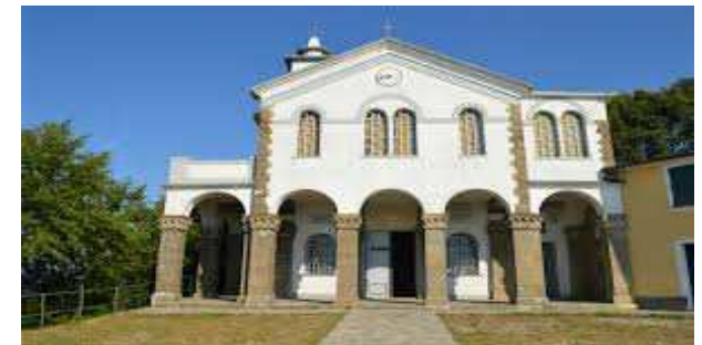
Il Santuario N.S. di Caravaggio

Per i non Soci: + € 10 per l'assicurazione obbligatoria, con indicazione di nome, cognome e data di nascita, entro il 24 gennaio.